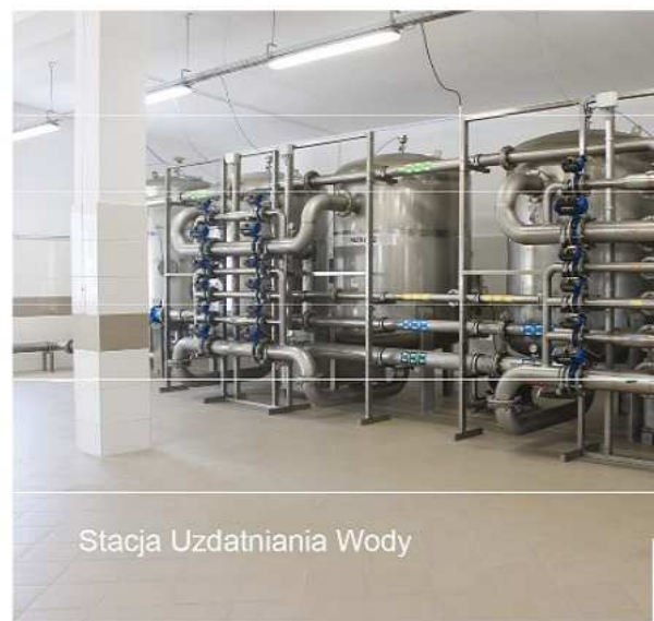
Stacja Uzdatniania Wody

W ramach Narodowego Funduszu Ochrony Środowiska i Gospodarki Wodnej w Warszawie wykonano termomodernizację wraz z likwidacją kotłowni węglowych w budynkach Zespołu Szkół w Cewkowie i Szkoły Podstawowej w Ułazowie, a także wymieniono pokrycie w części dydaktycznej „starej” szkoły w Starym Dzikowie oraz przebudowano salę sportową.