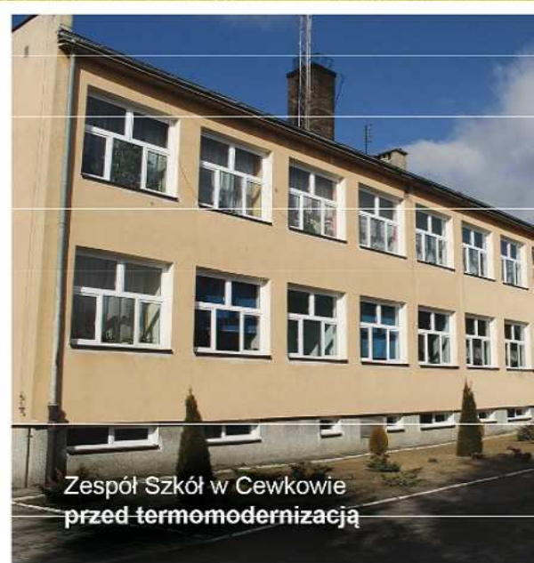
Zespół Szkół w Cewkowie przed termomodernizacją