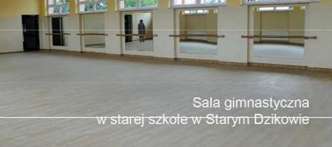
Sala gimnastyczna w starej szkole w Starym Dzikowie