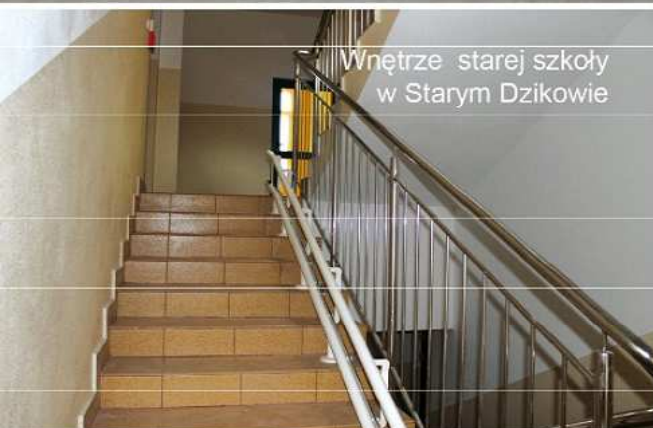
Wnętrze starej szkoły w Starym Dzikowie