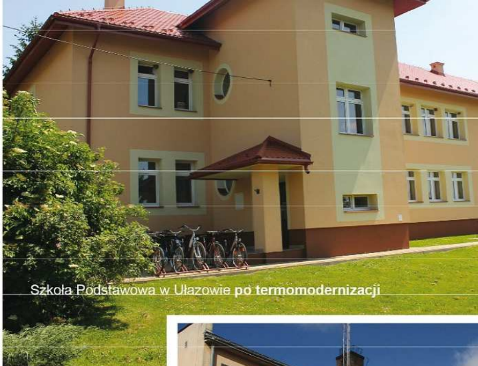
Szkoła Podstawowa w Ułazowie po termomodernizacji